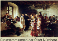
Kunstsammlungen der Stadt Nürnberg

Die Kunstsammlungen der Stadt Nürnberg. Sie zählen zu den ältesten und größten kommunalen Kunstbeständen des deutschsprachigen Raumes. Bereits im 15. Jahrhundert verwahrte man geschenkte und erworbene Kunstwerke in der Ratsbibliothek. Ein Teil wird im Stadtmuseum Fembohaus dauerhaft präsentiert. Viele Kunstschätze sind als Leihgabe in Museen, öffentlichen Räumen und bei Sonderausstellungen zu sehen. The art collection of Nuremberg. Part of the collection is exhibited at the City Museum Fembohaus.