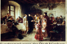
Kunstsammlungen der Stadt Nürnberg

Bereits im 15. Jahrhundert verwahrte man geschenkte und erworbene Kunstwerke in der Ratsbibliothek. Ein Teil wird im Stadtmuseum Fembohaus dauerhaft präsentiert. Viele Kunstschätze sind als Leihgabe in Museen, öffentlichen Räumen und bei Sonderausstellungen zu sehen. The art collection of Nuremberg. Part of the collection is exhibited at the City Museum Fembohaus.